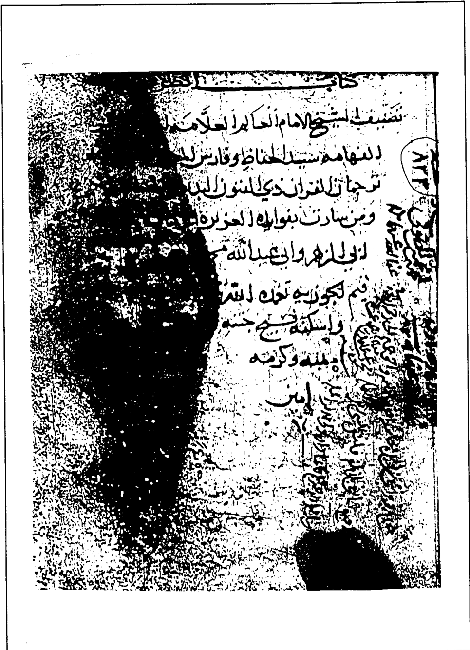
صفحة العنوان من نسخة تشستريتي (د)